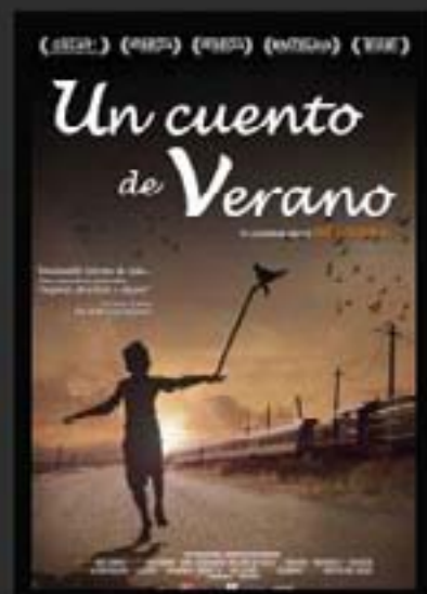
UN CUENTO DE VERANO